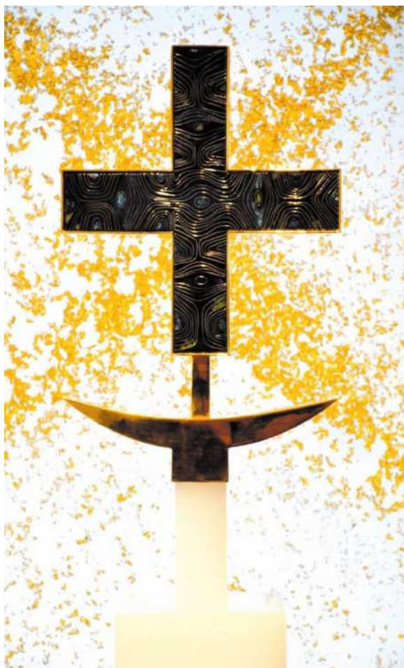
sculpture de Philippe Denis – chapelle Espace Prémontrés