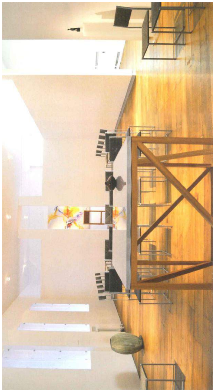
Chapelle Espace Prémontrés (1 er étage)