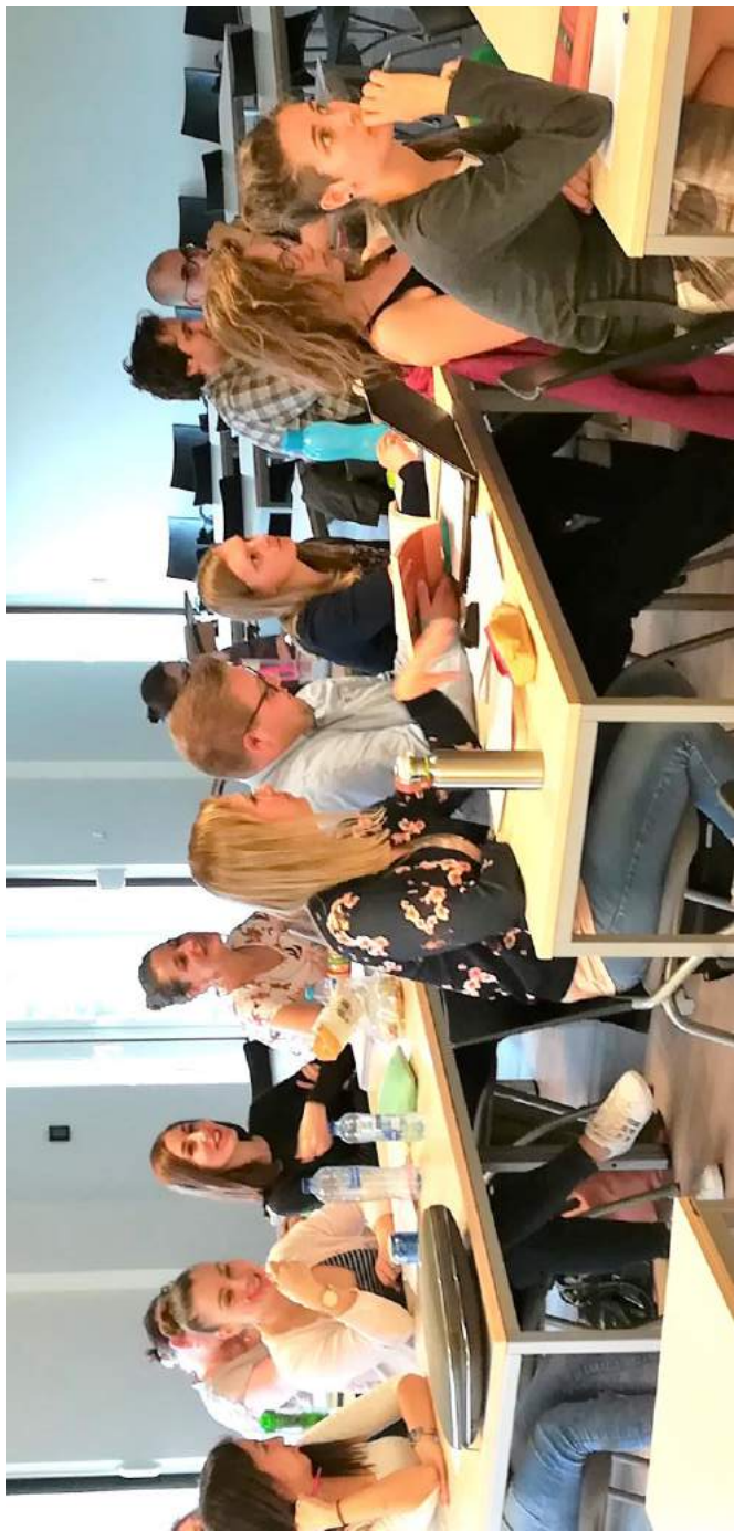
Étudiants du Certificat d'université en Didactique du cours de religion catholique - CDER