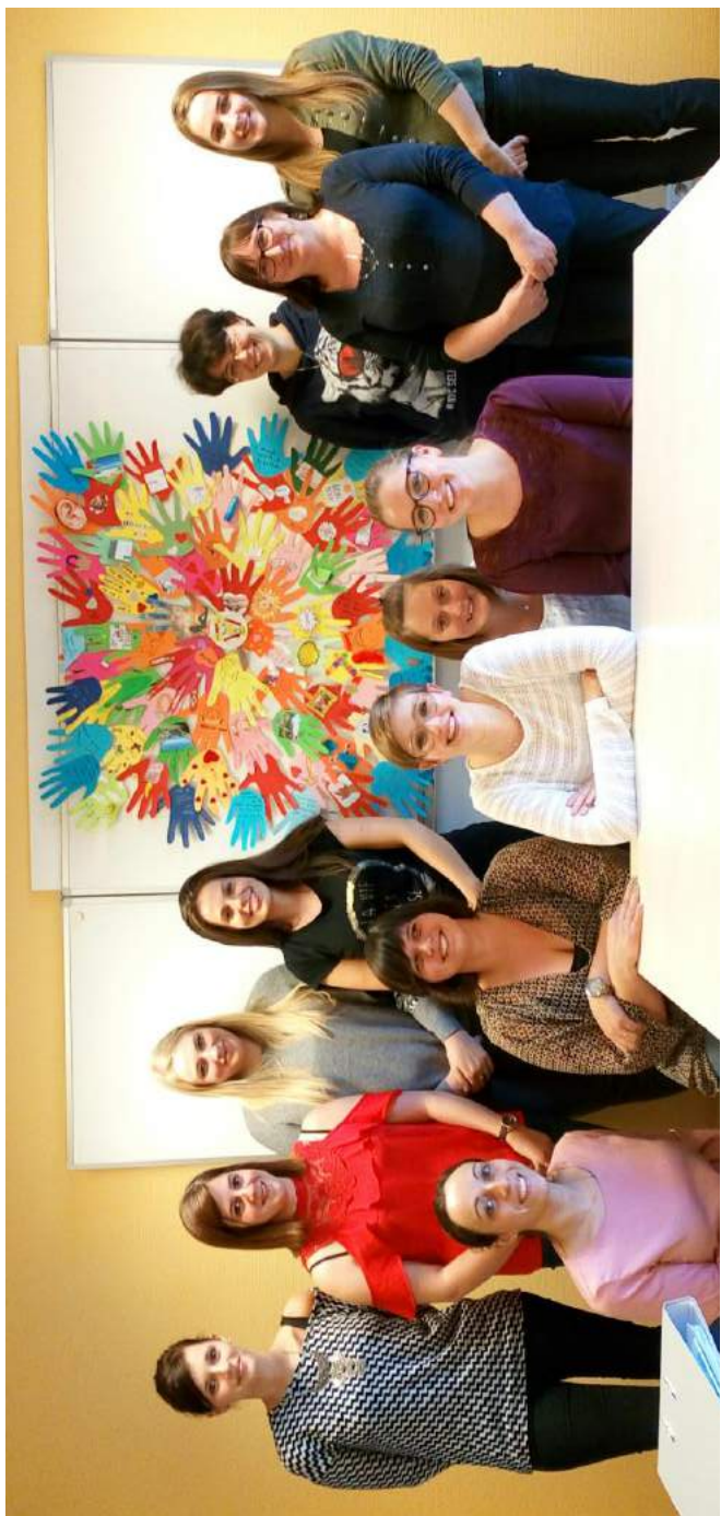
Étudiantes du Certificat du Fondamental - Réalisation du module sur la pédagogie religieuse englobante