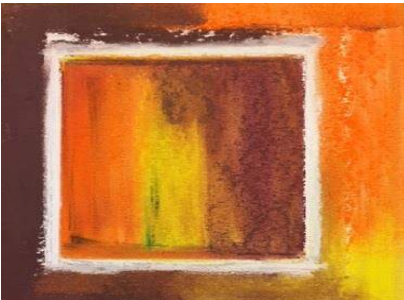
OUVERTURE, œuvre de Pierre HURTGEN, jeune talent liégeois