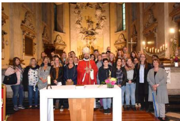
Envoi et bénédiction des finalistes rentrée académique septembre 2018