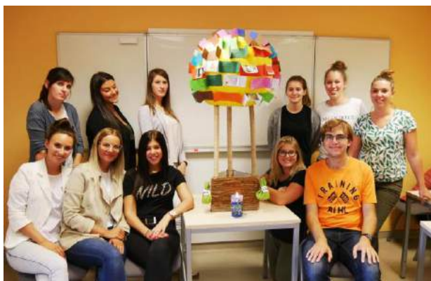
Certificat du fondamental – module de didactique